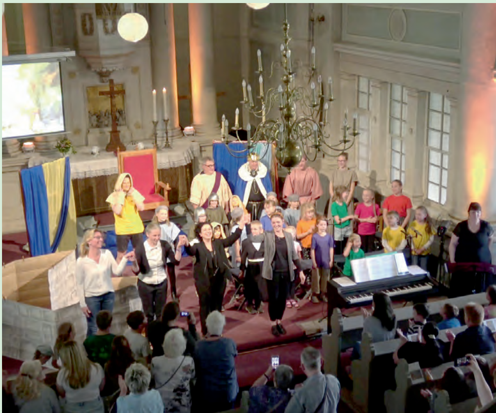
Aufführung des Kindermusicals „Daniel in der Löwengrube“ im Rahmen des Projekts „Musik verbindet“ in der Schlosskirche Netzschkau am 8. Juni 2024.

„Der Herr heilt, die zerbrochenen Herzens sind, und verbindet ihre Wunden.“